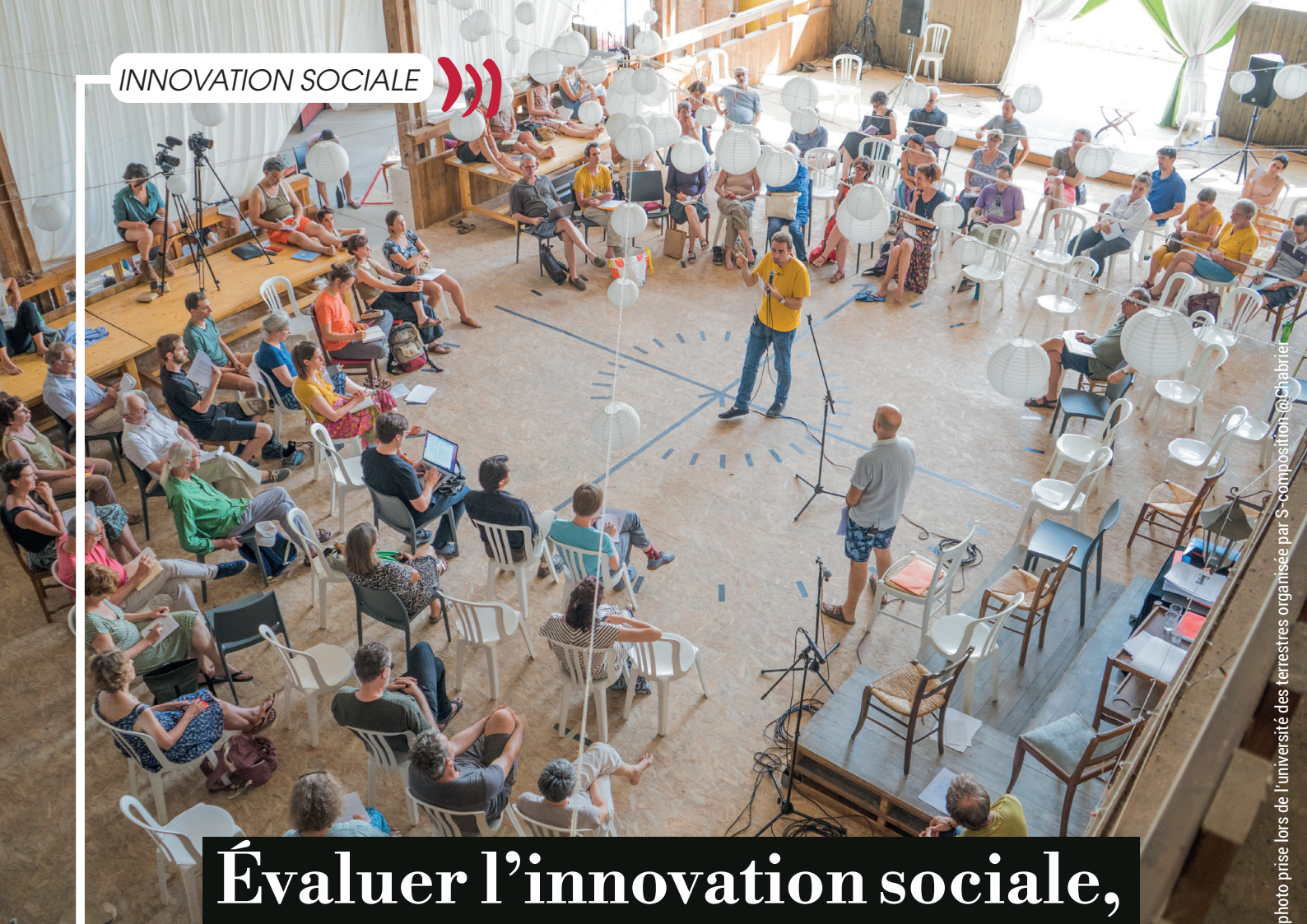
photo prise lors de l'université des terres organisées par S-composition @Chabrier