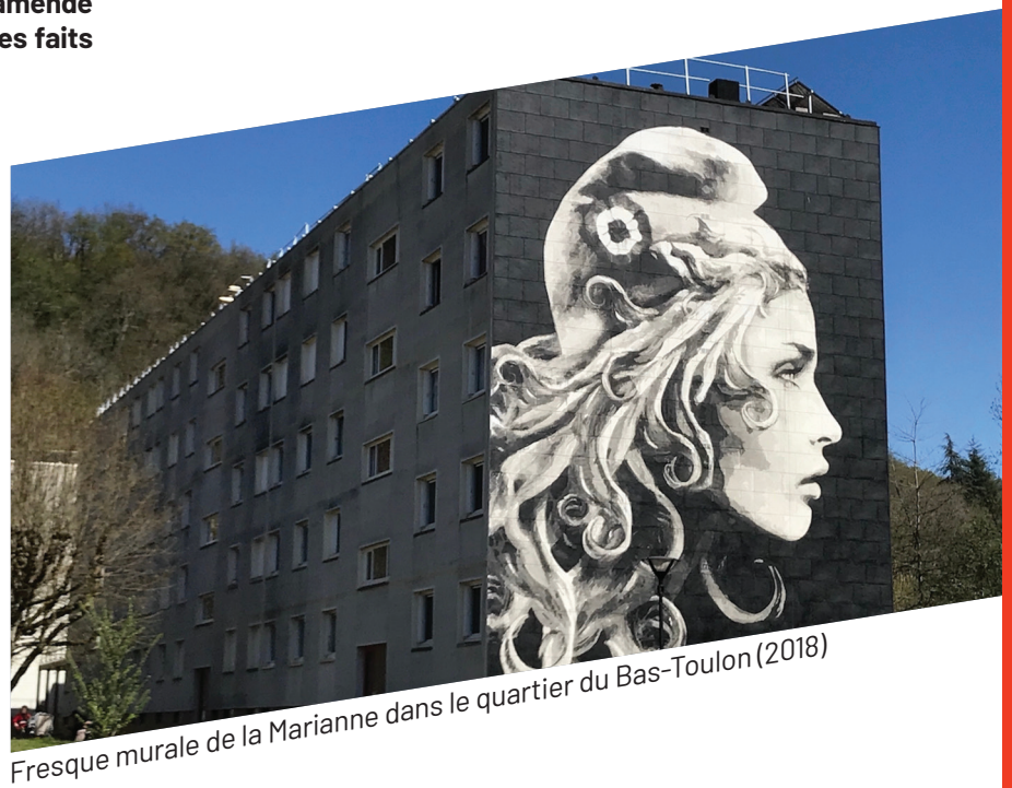
Fresque murale de la Marianne dans le quartier du Bas-Toulon (2018)

La discrimination est directe lorsqu'elle est délibérée et que la différence de traitement se base sur un critère prohibé par la loi : par exemple, le refus de louer un appartement à une personne homosexuelle ou en raison de son origine. La discrimination est indirecte lorsque, dans une situation comparable, un critère ou une pratique neutre en apparence produit des effets inéquitables et discriminatoires envers une personne ou un groupe : par exemple l'absence de possibilités d'accès des personnes handicapées aux transports en commun.