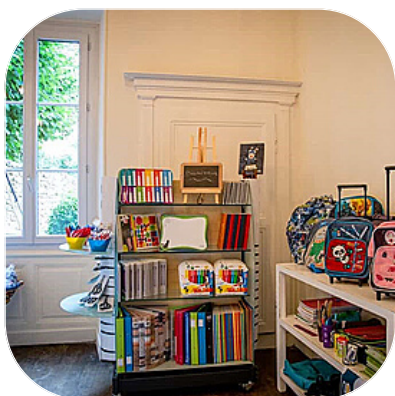
Épicerie solidaire de la MJC

L'approvisionnement de la légumerie est prévu à 90 % d'achats de produits locaux et 10 % de produits de ramasse (récupération d'invendus). On compte entre cinq et dix fournisseurs de légumes et/ou fruits se trouvant tous en Nouvelle-Aquitaine, la majoritairement de la Vienne. Ils sont transformés en 1ère (produits frais et brut) et 2ème gamme (conserve et semi-conserve).